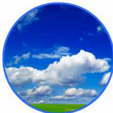
CONDIZIONAMENTO AIR CONDITIONING