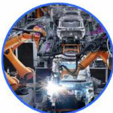
RAFFREDDAMENTO PROCESSI PROCESS COOLING